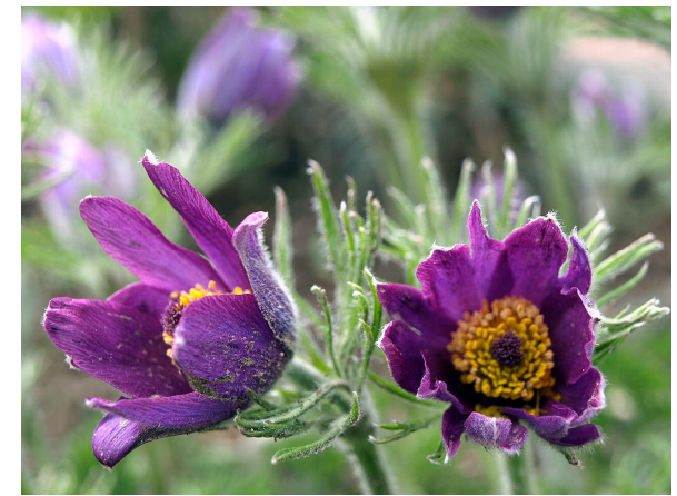
Die Kuchenschelle ( Pulsatilla vulgaris ), die ebenfalls gefährdet ist, verdankt ihren Namen der Ähnlichkeit der Blüten mit kleinen Kuhglocken („Kuhshellen“, kleine Kuh = „Kühchen“, später „Küchen“)

Die Ausstellung „Die letzten ihrer Art – Gefährdete Wildpflanzen in Botanischen Gärten“ kann bis Ende August während der Öffnungszeiten des Botanischen Gartens besucht werden.