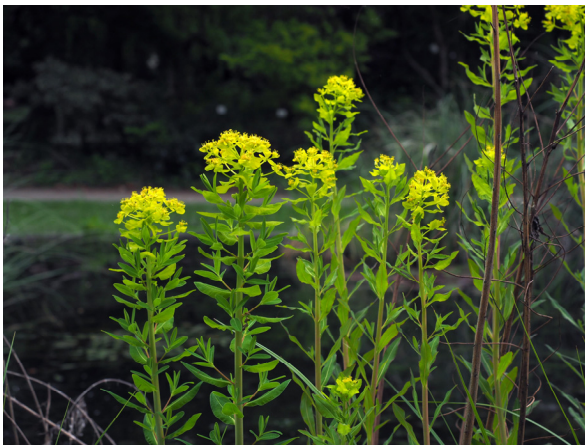
Die seltene Sumpf-Wolfsmilch ( Euphorbia palustris ) besiedelt periodisch überschwemmte Böden