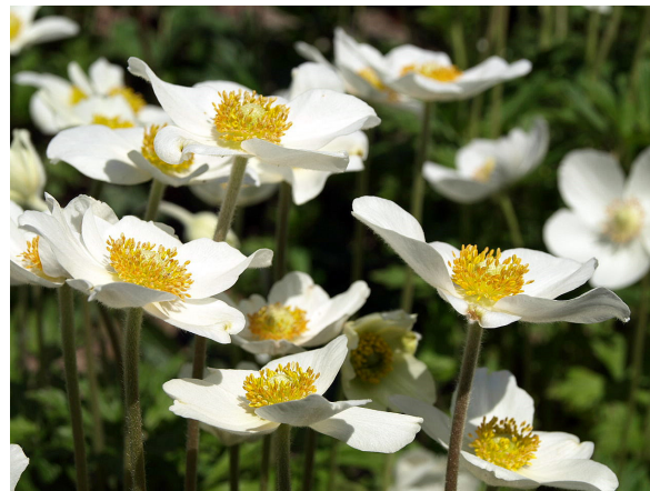
Das Große Windröschen ( Anemone sylvestris ) ist stark gefährdet – im Gegensatz zu dem bekannten und weit verbreiteten Wald-Windröschen ( Anemone sylvatica )

13:00 Führung durch die Ausstellung „Die letzten ihrer Art – Gefährdete Wildpflanzen in Botanischen Gärten“